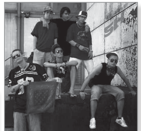
A banda nem beszél mellé. Még egy nagy ugrás kell az ismertséghez. Addig: www.myspace.com/skarlathorda

☛ Mikor vettétek fel az első számot? Melyik