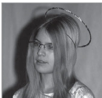
FELVÉTELEINK CSAK ILLUSZTRÁCIÓK

Az első napok az ismerkedésről szóltak. Aztán beindult