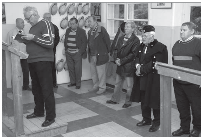
A Rozmaringos együttes fergeteges hangulatot teremtett

Az idelátogató tanulók nemcsak városunk régi fő iparágát ismerhetik meg, de tudomást szerezhetnek arról is, hogy milyen volt városunk