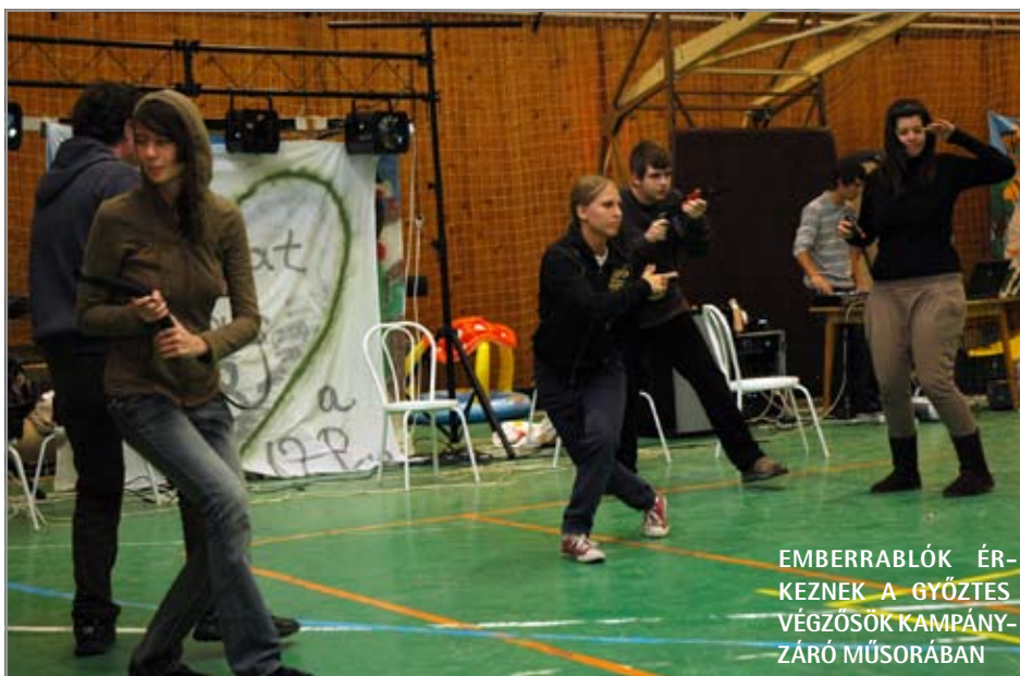
EMBERABLÓK ÉRKEZNEK A GYŐZTES VÉGZŐSÖK KAMPÁNYZÁRÓ MŰSORÁBAN