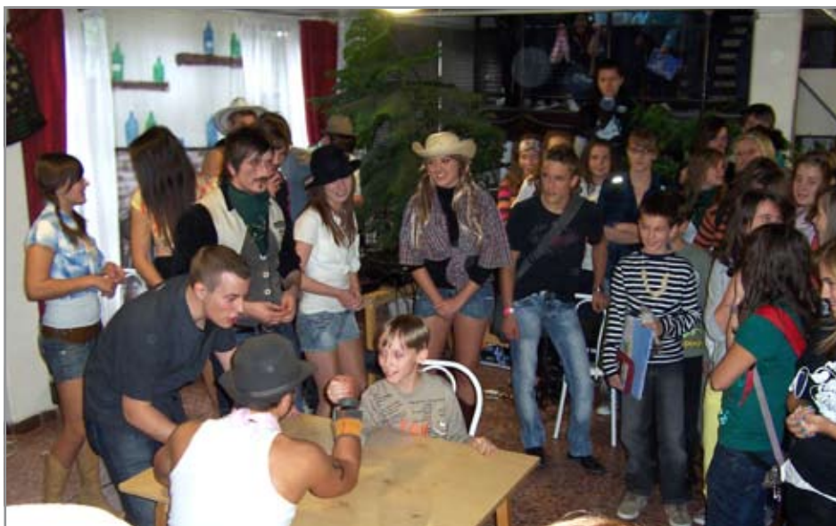
Szkandercsata a 12. d nagyszüneti programjában

És a végére kell még egy mondat, ami a kampány alatt tudatosult bennem: 12. b, én így szeretlek! JÁRFÁS VIVIEN