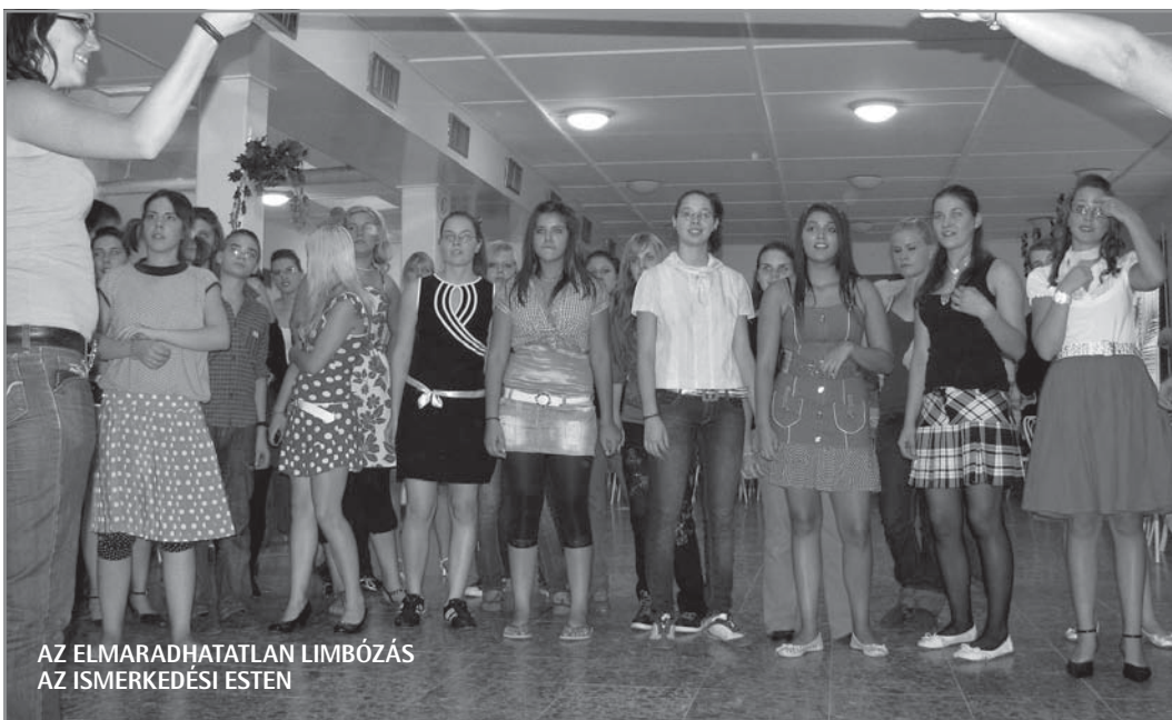
AZ ELMARADHATLAN LIMBÓZÁS AZ ISMERKEDÉSI ESTEN